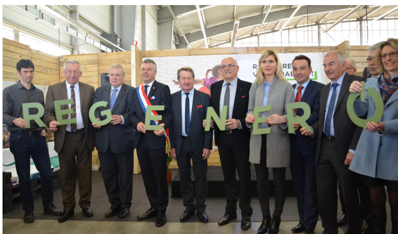
Lancement de la plateforme REGENERO par les élus et représentants des collectivités du Genevois français.

L'ensemble des intercommunalités du Genevois français, avec leurs partenaires institutionnels et professionnels, se sont fédérés pour réfléchir et proposer un dispositif capable de mieux faire se rencontrer les projets de rénovation énergétique des propriétaires et l'environnement technique et financier capable de répondre à leurs besoins.